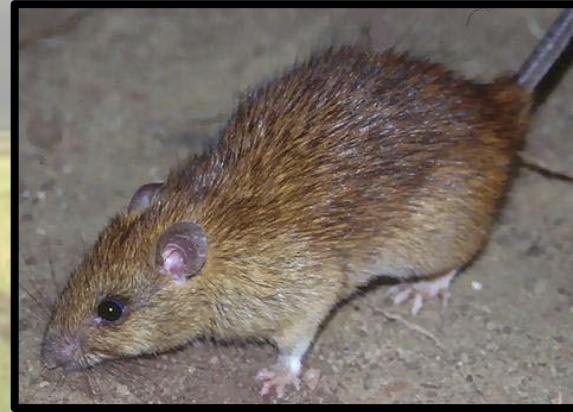
இந்த நோயைக் காவும் காவி